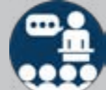
مدیریت شبکه‌های اجتماعی

تبلیغات بنری یکی از راه‌های موثر برای معرفی محصول و خدمات شماست. در این نوع تبلیغات به واسطه‌ی دیده شدن برند شما، حتی اگر کلیکی صورت نگیرد، به صورت پیش فرض باعث افزایش آگاهی (Awareness) درباره‌ی برند شما خواهد شد و شما می‌توانید در کنار معرفی محصول و خدمات‌تان، پیشنهاد و تخفیف‌های خود را نیز به جامعه بزرگی نمایش دهید. تبلیغات بنری روشی موثر برای بالا بردن ترافیک شماست؛ همچنین با توجه به تعداد نمایش بالای آگهی‌ها، این روش منجر به برندسازی می‌شود.